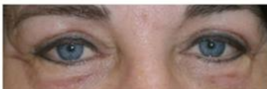
10 Tage nach der Behandlung