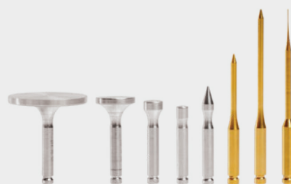
APPLICATEURS POUR PLASMA PEN MEDICAL

Pointe fine = développée pour le traitement du trichiasis, s'introduit dans le follicule.